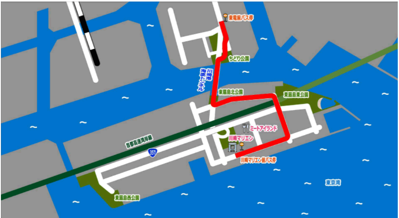
* マップの出典 かながわらく楽ウォーキング