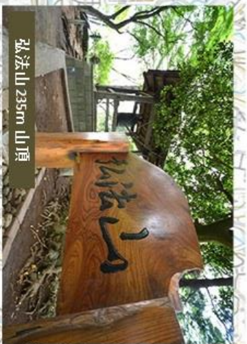
弘法山 235m 山頂