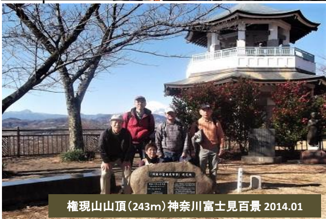
権現山山頂(243m) 神奈川富士見百景 2014.01