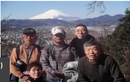
浅間山山頂 (196m) 2014.01 全員若い