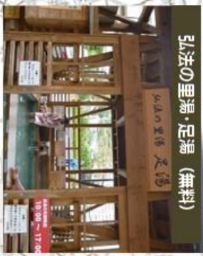
弘法の里湯・足湯 (無料)