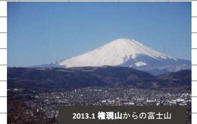
2013.1 権現山からの富士山